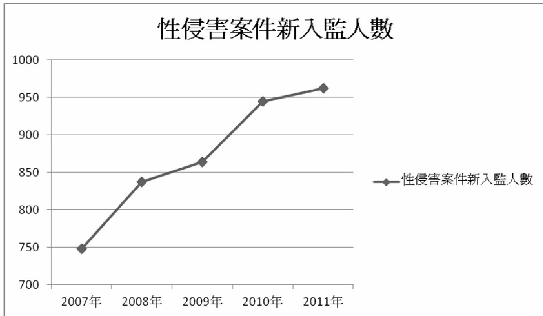
圖二、性侵害受刑人新入監人數統計

上述的資料為在監累積人數，某一分面來說，成長是必然的。但是根據新入監之人數統計資料顯示，至 2007 以來，因性侵害判決確定而入監人數從 748 人，2011 年已達 962 人，每年新入監的人數乃呈現增加之趨勢，甚至沒有停滯的現象。2012 年之資料僅統計至 5 月為止，計算的區間尚不足半年，因而未顯示於圖表之上，但是根據統計資料呈現，5 個月來已經有 439 人因為性侵害而入獄，從此數字合理推估本年度的統計值，應是有增無減，只可能越來越嚴重。